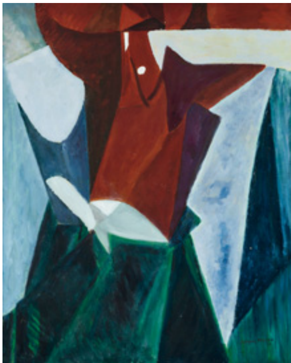
Jacques Villon (1875–1963) Homme lisant. 1926 Kat.-Nr. 43, Schätzpreis € 10.000, Ergebnis € 19.050