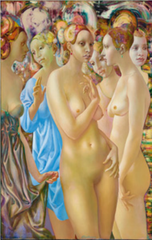
Normunds Braslins (*1962) Ceremonija. 2002 Kat.-Nr. 172, Schätzpreis € 800, Ergebnis € 10.795