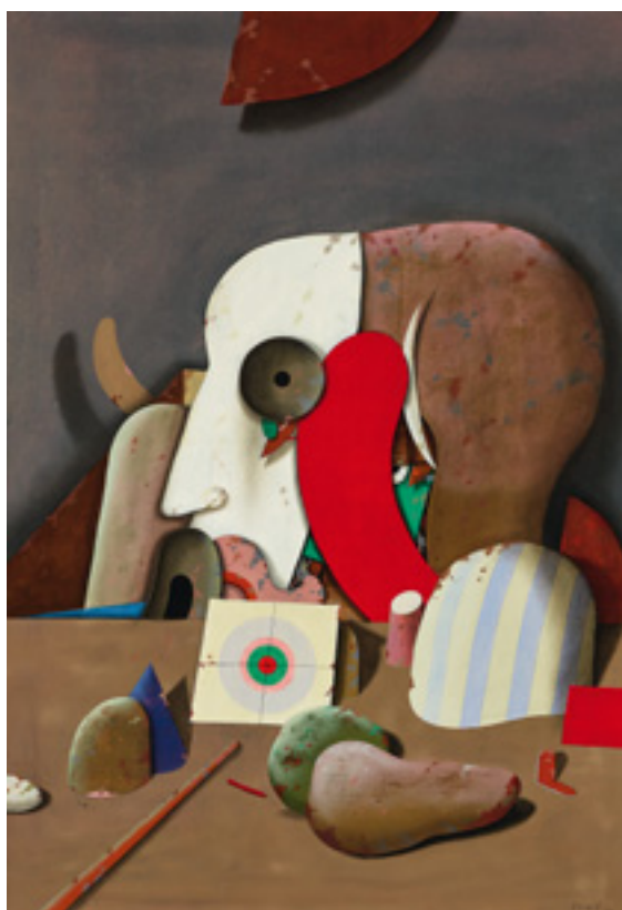
Karl Korab (*1936) Ohne Titel. 1974 Kat.-Nr. 133, Schätzpreis € 5.000, Ergebnis € 10.795