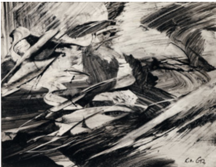
Karl Otto Götz (*1914) Wolfsschlucht. 1959 Kat.-Nr. 83, Schätzpreis € 4.000, Ergebnis € 10.160