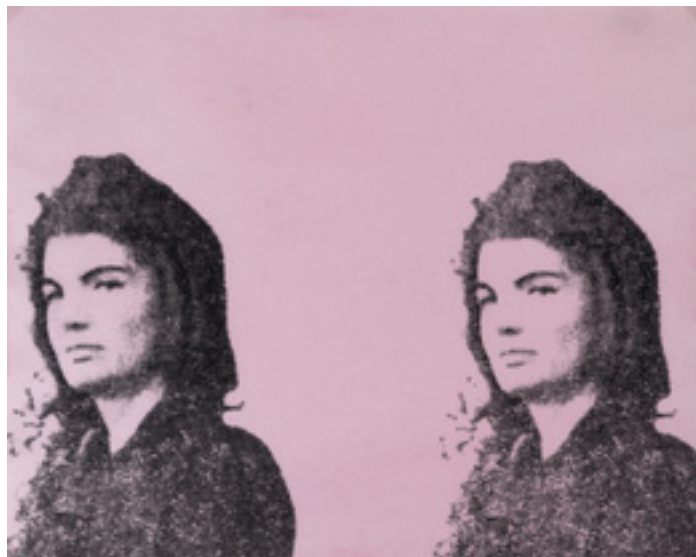
Andy Warhol (1928–1987) Jackie II". 1960 Kat.-Nr. 110, Schätzpreis € 10.000, Ergebnis € 15.240