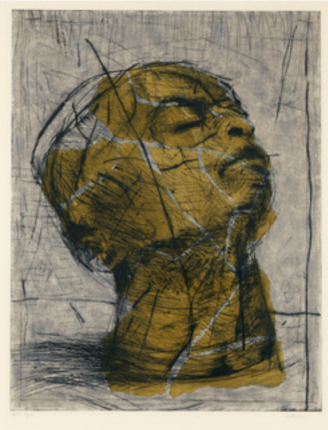
William Kentridge (*1955) Head (Green). 1992 Kat.-Nr. 149, Schätzpreis € 35.000, Ergebnis € 44.450

Gerhard Richters, aus dem Jahr 1969 stammende Folge von Offsetdrucken, war einem süddeutschen Sammler am Telefon € 22.860 wert (Kat.-Nr. 104, Schätzpreis € 18.000). Das Ölgemälde „Homme lisant“ aus dem Jahr 1926 von Jacques Villon, einem Halbbruder Marcel Duchamps (Kat.-Nr. 43, Schätzpreis € 10.000), ersteigerte ein privater Bieter von der amerikanischen Ostküste für € 19.050.