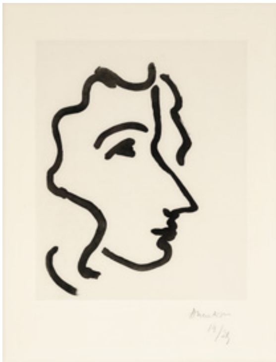
Henri Matisse (1869–1954) Nadia au profil aigu. 1948 Kat.-Nr. 46, Schätzpreis € 14.000, Ergebnis € 24.130