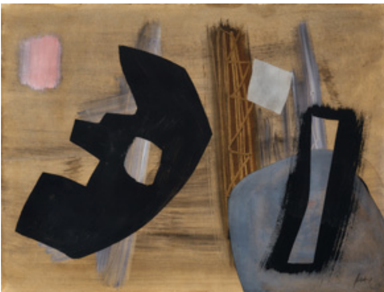
Fritz Winter (1905–1976). Positiv-negativ. 1954. Schätzpreis € 12.000, Ergebnis € 16.510