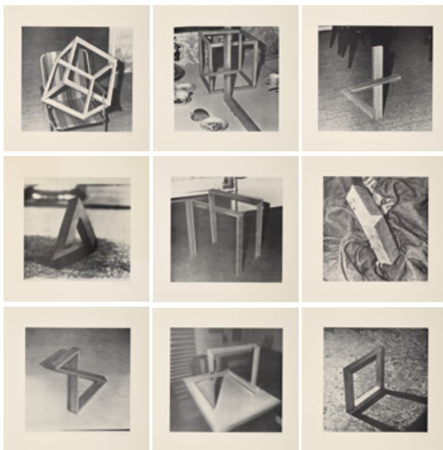
Gerhard Richter (*1932) Folge von Offsetdrucken. 1969 Kat.-Nr. 104, Schätzpreis € 18.000, Ergebnis € 22.860