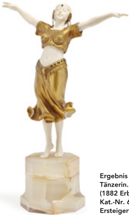
Ergebnis 4.700 Euro Tänzerin. Ferdinand Preiss (1882 Erbach–1943 Berlin) Kat.-Nr. 63, Schätzpreis 1.500 Euro Ersteigert durch süddeutschen Händler