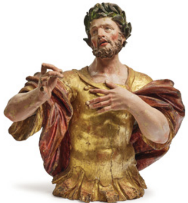
Ergebnis 6.980 Euro Hl. Donatus Oberösterreich, um 1700. Thomas Schwanthaler (1634 Ried im Innkreis–1707 ebenda), Umkreis Kat.-Nr. 97, Schätzpreis 2.400 Euro Ersteigert durch einen deutschen Sammler