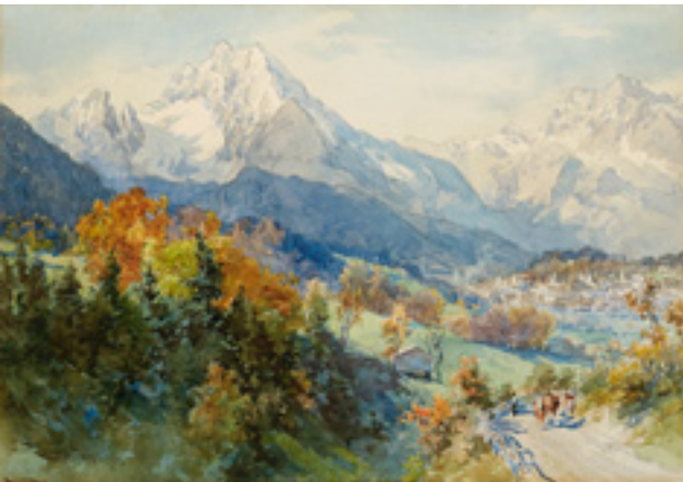
Ergebnis 5.330 Euro Edward Theodore Compton (1849 London–1921 Feldafing) Blick auf Berchtesgaden und den Watzmann Kat.-Nr. 155, Schätzpreis 2.500 Euro Ersteigert durch einen französischen Sammler