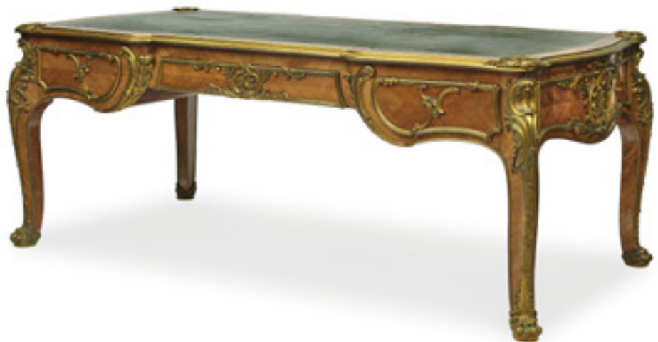
Ergebnis 17.780 Euro Bureau Plat. Louis-XV-Stil, um 1900 Kat.-Nr. 124, Schätzpreis 1.600 Euro Ersteigert durch süddeutschen Käufer