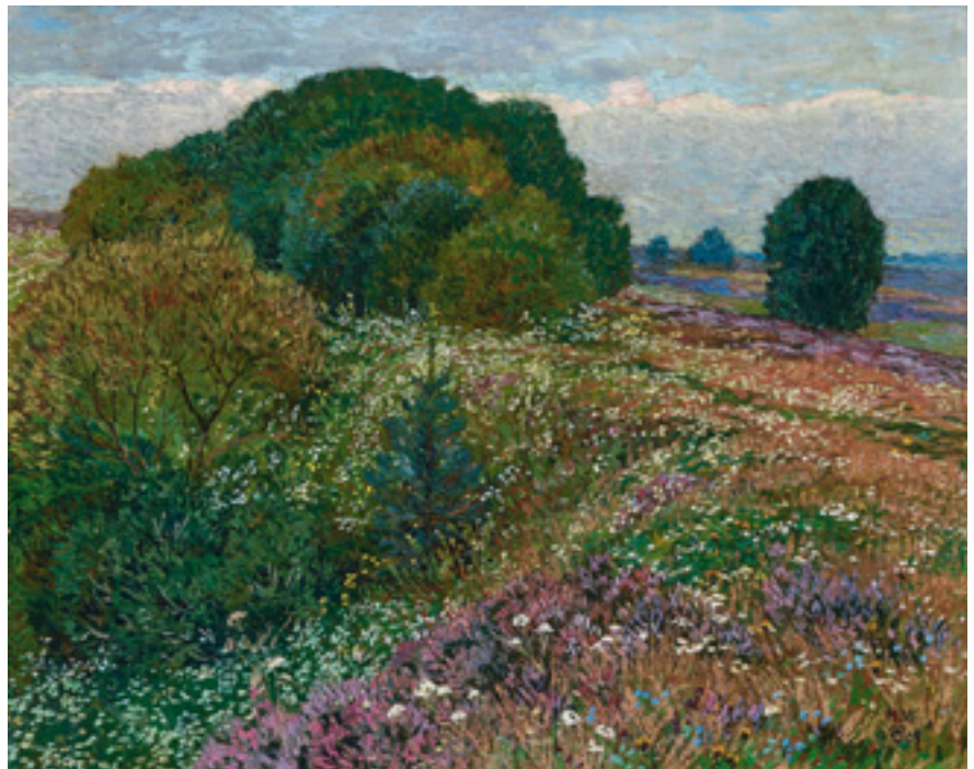
Ergebnis 35.560 Euro Heinrich Vogeler (1802 Bremen–1866 Kasachstan) Am Rand der Heide Kat.-Nr. 289, Schätzpreis 10.000 Euro Ersteigert durch einen westdeutschen Privatsammler