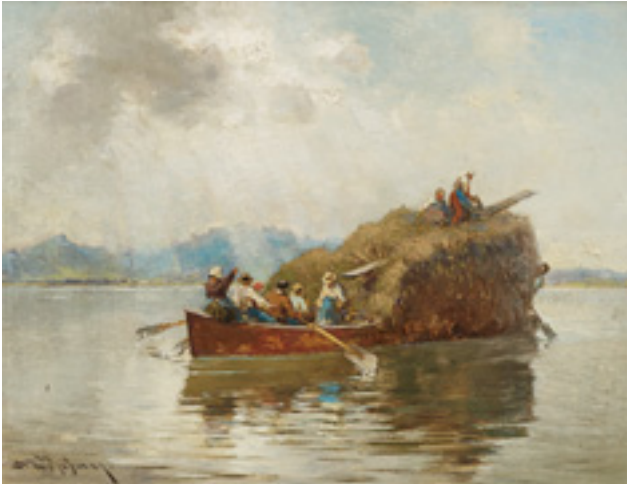
Ergebnis 15.240 Euro Josef Wopfner (1843 Schwaz am Inn–1927 München) Heuboot auf dem Chiemsee Kat.-Nr. 283, Schätzpreis 3.000 Euro Ersteigert durch einen süddeutschen Privatsammler