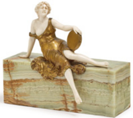
Ergebnis 5.200 Euro Sitzende mit Tambourin. Ferdinand Preiss (1882 Erbach–1943 Berlin) Kat.-Nr. 64, Schätzpreis 1.500 Euro Ersteigert durch österreichischen Händler