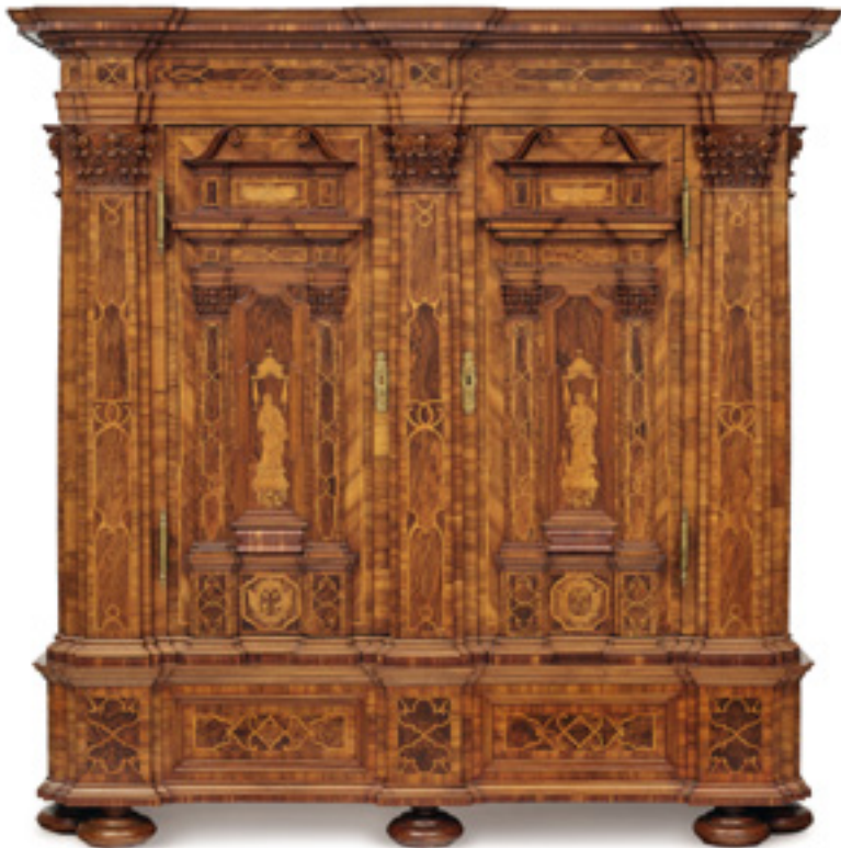
Ergebnis 69.850 Euro Fassadenschrank. Regensburg, um 1750 Kat.-Nr. 110, Schätzpreis 30.000 Euro Ersteigert durch süddeutschen Sammler