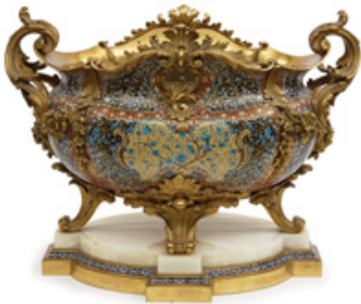
Ergebnis 24.130 Euro Prunkjardiniere. Historismus Kat.-Nr. 85, Schätzpreis 1.400 Euro Ersteigert durch einen belgischen Händler