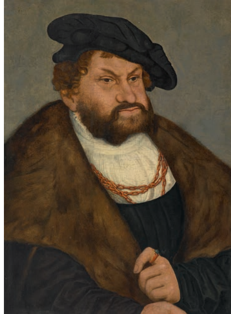
Lucas Cranachs d. Ä. Johann der Beständige von Sachsen Kat.-Nr. 355, Ergebnis € 69.850 (Schätzung € 60.000)