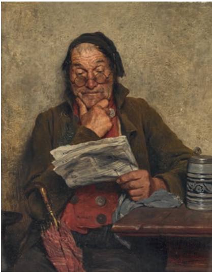
Hugo Kauffmann. Der Dorfpolitiker Kat.-Nr. 414 Ergebnis € 13.970 (Schätzung € 4.000)

Pressenachbericht Auktion ALTE KUNST 368 vom 1. Juli 2015