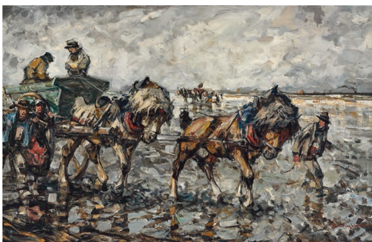
SONDERAUKTION Julius Seyler Krabbenfischer mit Pferdekarren. Kat.-Nr. 559 Ergebnis € 3.810 (Schätzung € 1.000).

NEUMEISTER MÜNCHEN . BERLIN . HAMBURG . KÖLN . WIEN . ZÜRICH . PALM BEACH