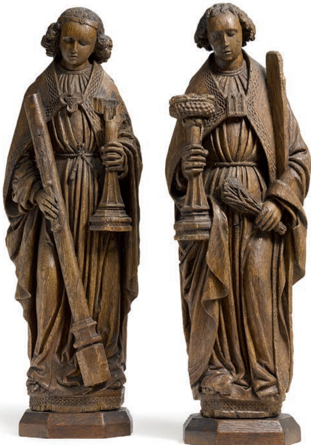
Ein Paar Leuchterengel, Niederrhein, um 1480 Kat.-Nr. 259, Ergebnis € 24.130 (Schätzung € 3.000)

NEUMEISTER MÜNCHEN . BERLIN . HAMBURG . KÖLN . WIEN . ZÜRICH . PALM BEACH