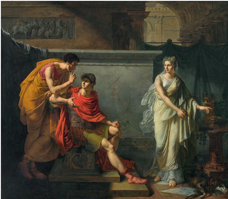
Frankreich oder Italien. Szene aus der römischen Geschichte Kat.-Nr. 364, Ergebnis € 48.260 (Schätzung € 6.000)

Pressenachbericht Auktion ALTE KUNST 368 vom 1. Juli 2015