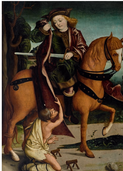
Heiliger Martin und Heiliger Georg. Schwaben, 15. Jh. Kat.-Nr. 344, Ergebnis € 66.040 (Schätzung € 15.000)