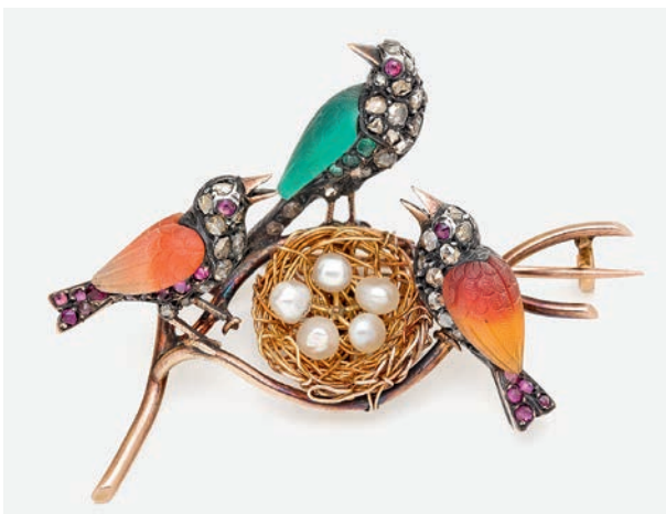
Brosche in Form eines Vogelneastes. England, ca. 1885/90 Kat.-Nr. 596, Ergebnis € 13.335 (Schätzung € 7.000)