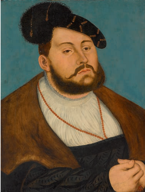
Lucas Cranach d. J., Werkstatt Johann Friedrich der Großmütige von Sachsen Kat.-Nr. 356, Ergebnis € 38.100 (Schätzung € 30.000)

Pressenachbericht Auktion ALTE KUNST 368 vom 1. Juli 2015