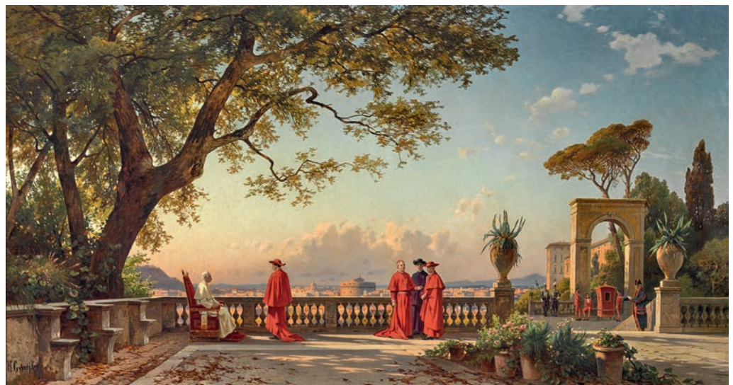
Hermann David Salomon Corrodi. Leo XIII. mit Kardinälen auf einer Terrasse über Rom Kat.-Nr. 489, Ergebnis € 24.130 (Schätzung € 10.000)

NEUMEISTER MÜNCHEN . BERLIN . HAMBURG . KÖLN . WIEN . ZÜRICH . PALM BEACH