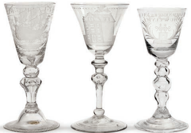
Drei Pokale, Niederlande 18. Jh. Kat.-Nr. 52, Ergebnis € 6.350 (Schätzung € 500)