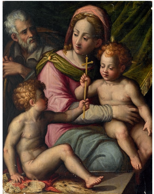
Toskana, Mitte 16. Jh. Heilige Familie mit dem Johannesknaben. Kat.-Nr. 346 Ergebnis € 21.590 (Schätzung € 5.000)