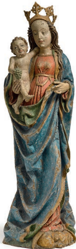
Mondsichelmadonna. Österreich, Ende 15. Jh. Kat.-Nr. 260, Ergebnis € 20.320 (Schätzung € 6.000)

Pressenachbericht Auktion ALTE KUNST 368 vom 1. Juli 2015