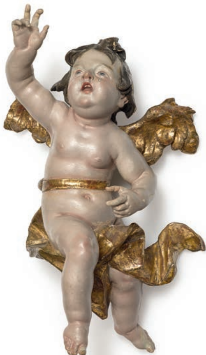
Christian Jorhan d.Ä.. Weinender Putto Kat-Nr. 254, Ergebnis € 31.750 (Schätzung € 8.000)

Pressenachbericht Auktion ALTE KUNST 368 vom 1. Juli 2015