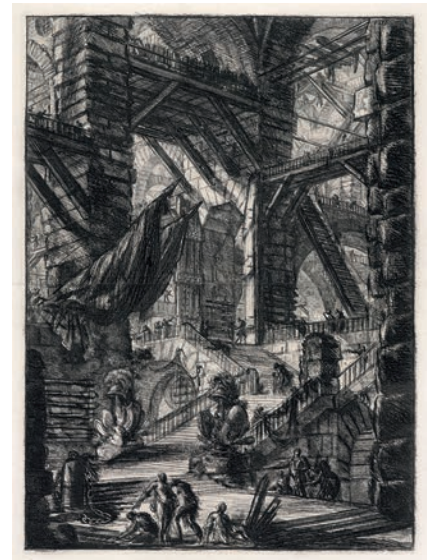
Giovanni Batista Piranesi. Carcere VIII. Kat.-Nr. 306 Ergebnis € 3.302 (Schätzung € 500)

NEUMEISTER MÜNCHEN . BERLIN . HAMBURG . KÖLN . WIEN . ZÜRICH . PALM BEACH