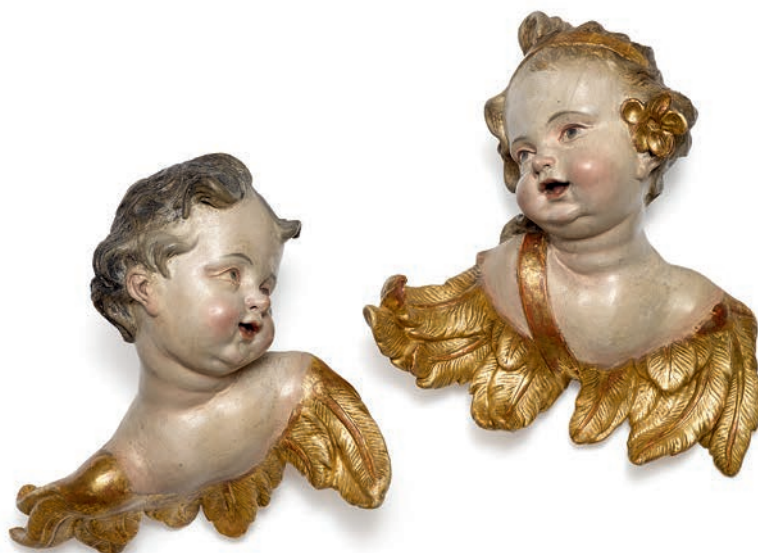
Christian Jorhan d.Ä., zugeschr. Ein Paar geflügelte Puttenköpfe Kat-Nr. 255, Ergebnis € 25.400 (Schätzung € 5.000)