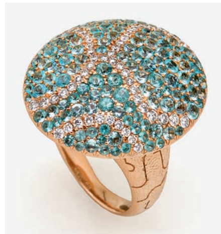
Cocktailring mit Paraiba-Turmalinen und Brillanten Kat.-Nr. 754, Ergebnis € 11.430 (Schätzung € 8.500)

NEUMEISTER MÜNCHEN . BERLIN . HAMBURG . KÖLN . WIEN . ZÜRICH . PALM BEACH